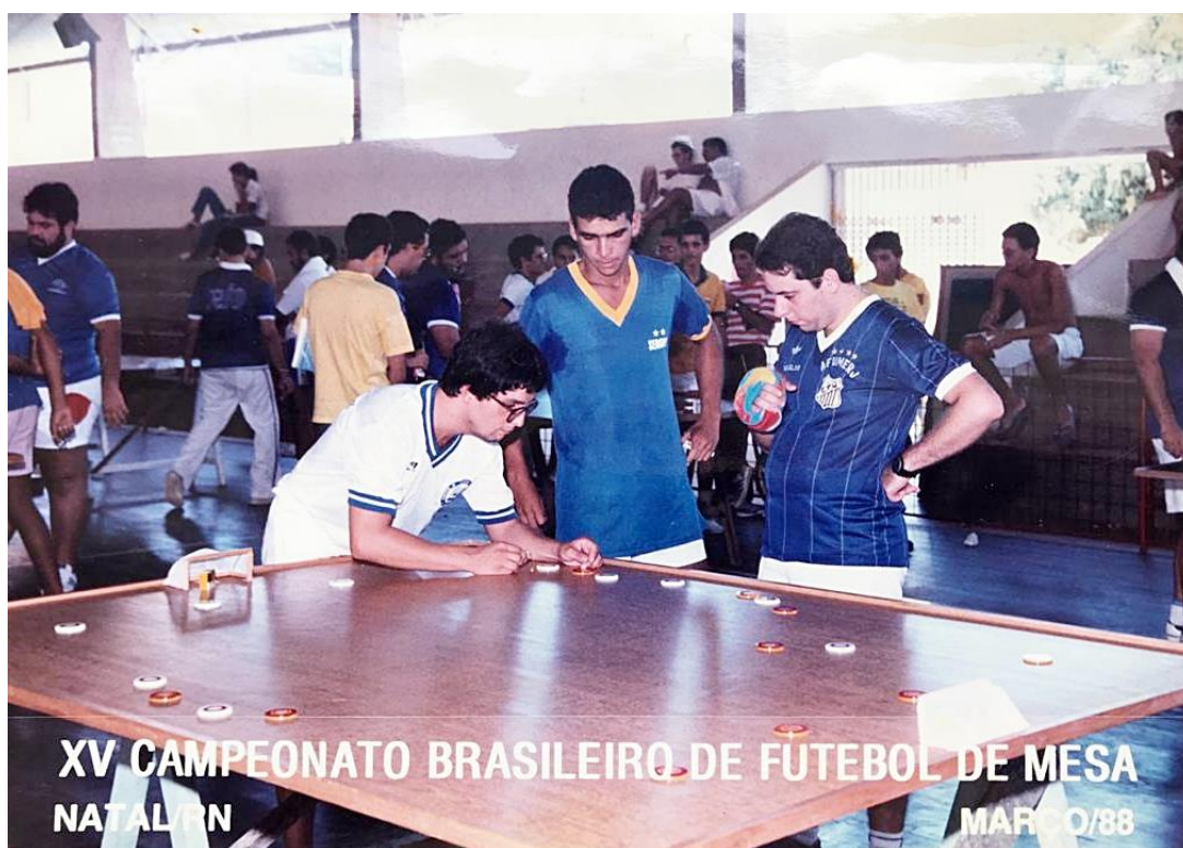
XV CAMPEONATO BRASILEIRO DE FUTEBOL DE MESA NATAL/RN MARÇO/88