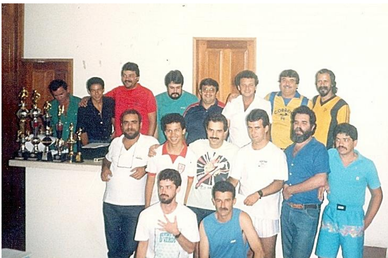
Alguns dos participantes do Campeonato Brasileiro Individual